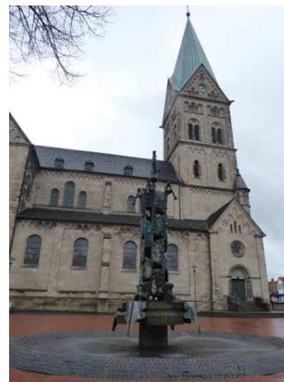
Herten, Altes Dorf Westerholt

Treffpunkt / Start: Marienbrunnen vor der Kirche Sankt Martinus, Schloßstraße 21, in Herten-Westerholt